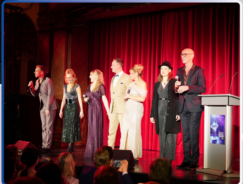
Publikumsaward: »Schäl Sick Story« Scala Theater Köln